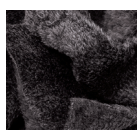
Длинные изолирующие волокна

Ткани Polartec® Thermal Pro® выпускаются различной плотности и различных видов для обеспечения адекватной степени изоляции и создания тканей уникального типа для разнообразной деятельности на открытом воздухе. Эти ткани являются последним достижением в области флисовых тканей.