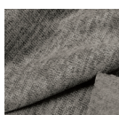
Свитер Rib Strie